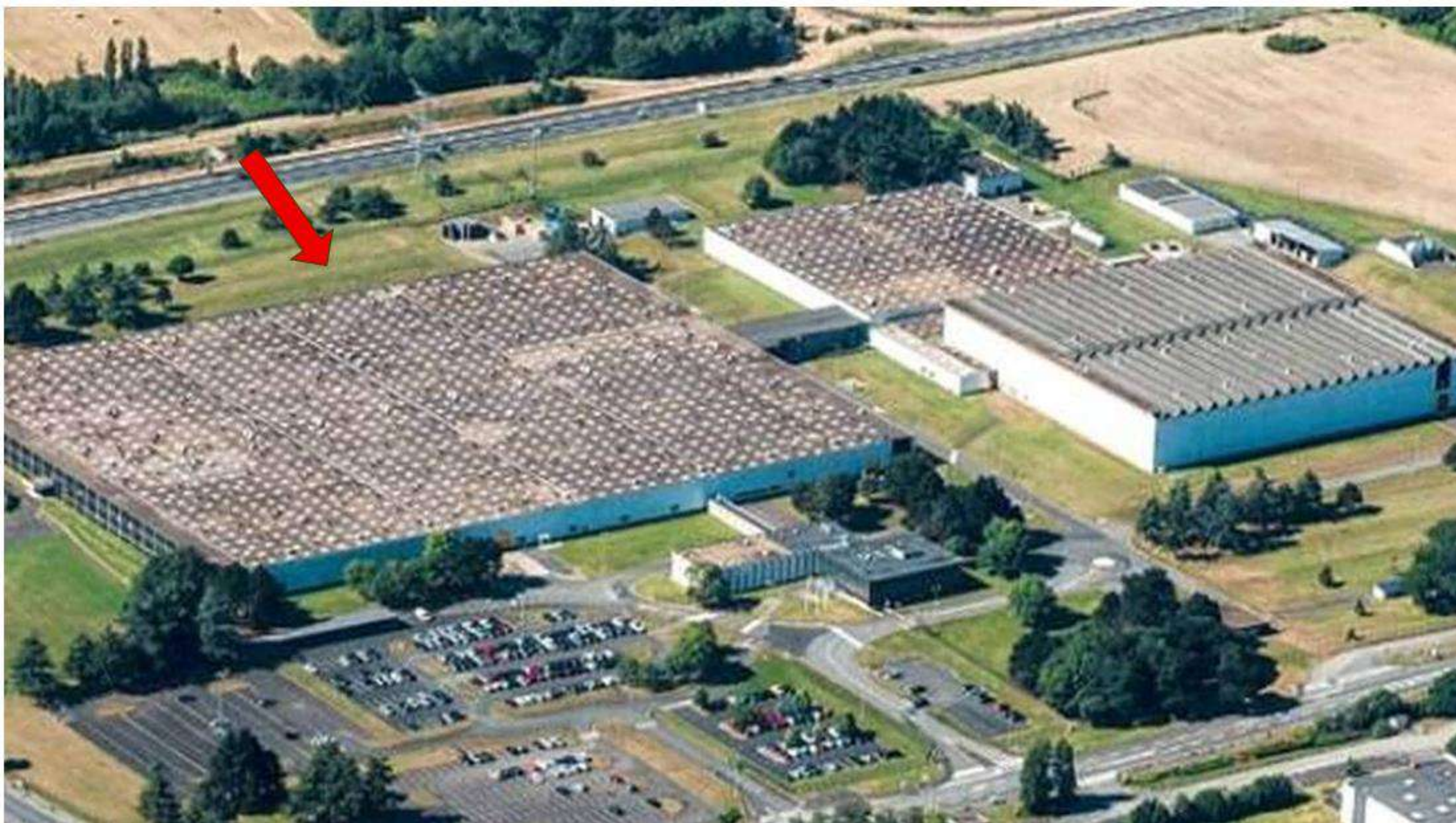
USINE HITACHI – ASTEMO à Saint Barthélemy d'Anjou (façades env. 280m x 200m).