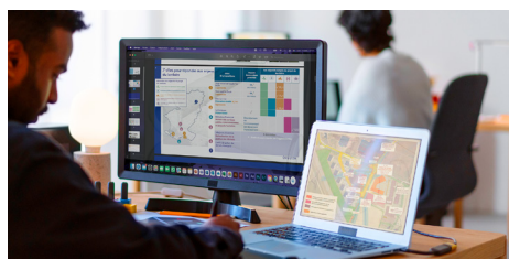
Transformer une opportunité stratégique en projet opérationnel