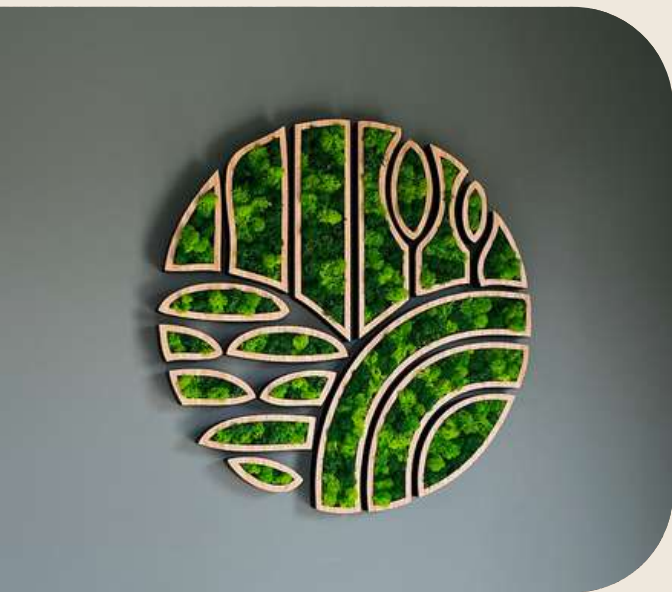
1. Logo végétalisé en Bois