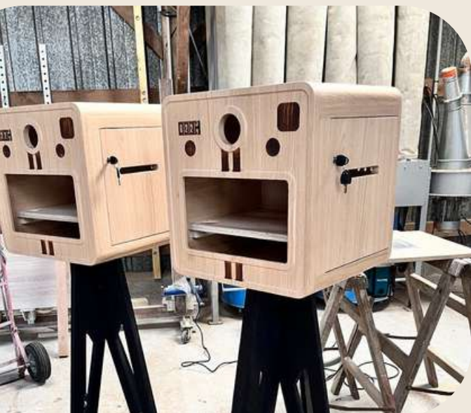
3. Prototypes de Photobooth pour marque bretonne