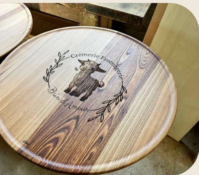
2. Plateau à fromages sur mesure