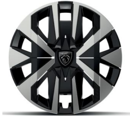
Jantes tôle 16" avec enjoliveurs MONTI Gris Eclat avec vernis brillant & noir grainé