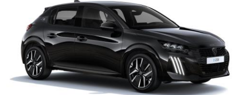
Noir Perla Nera M09V - Option