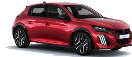
Rouge Elixir M5VH – Option sur Business R' uniquement