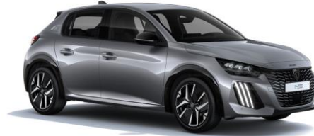
Gris Artense M0F4 - Option