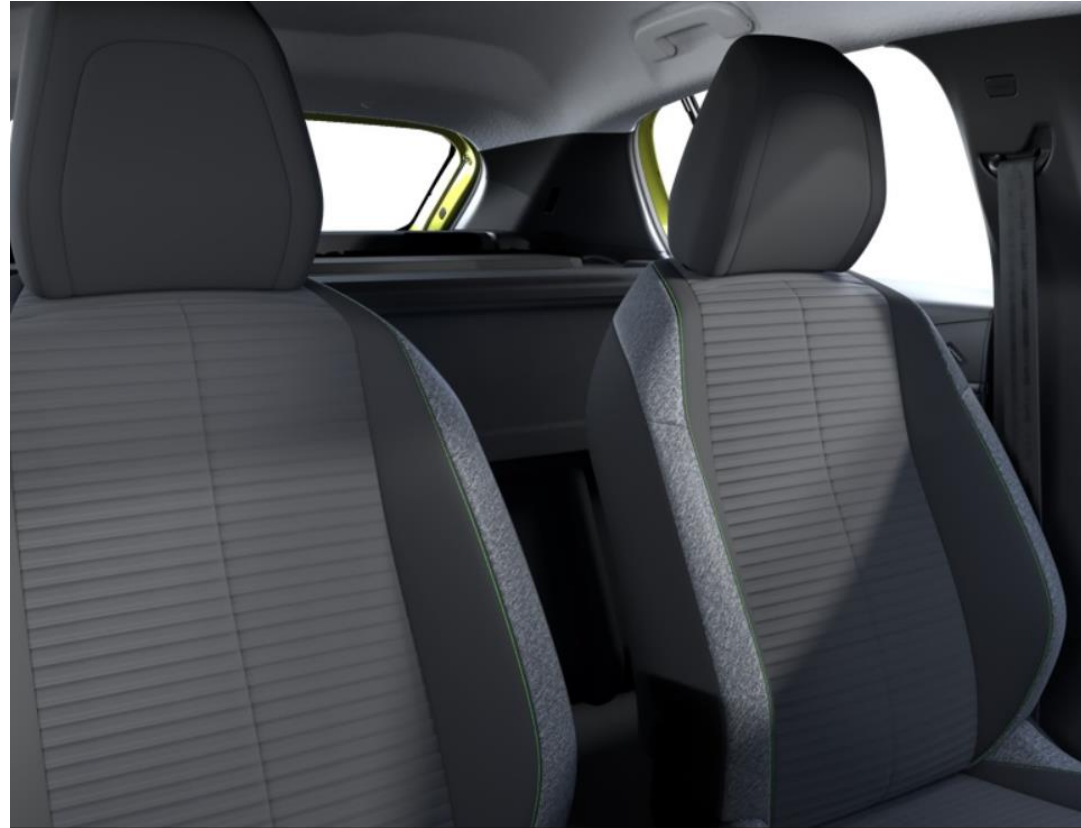
Sellerie tissu PNEUMA embossé 3D, tri-matières Leorki chiné et surpiqûres Vert Calcite ( Cache-bagages VU en rang 2 ) APFX