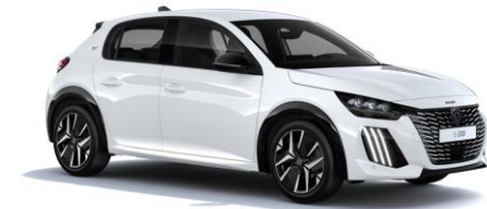
Blanc Banquise POWP - Option