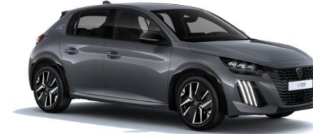
Gris Selenium M0LD - Option