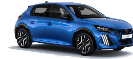
Bleu Vertigo M6SM – Option sur Business R' uniquement