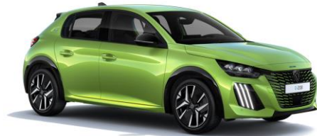
Jaune Agueda M0EQ – Teinte de série