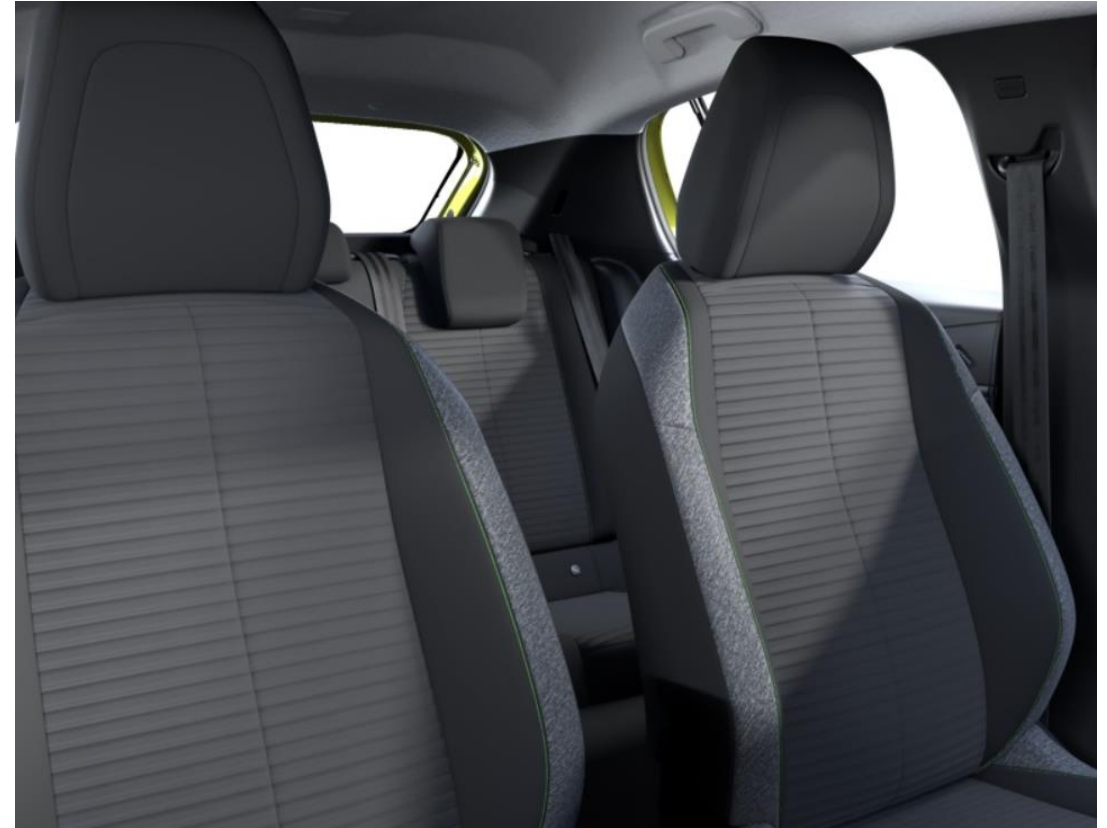
Sellerie tissu PNEUMA embossé 3D, tri-matières Leorki chiné et surpiqûres Vert Calcite ( Pack de transformation VP/VU ) APFX